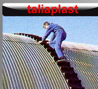
un toit en tôle