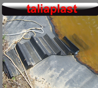
un bassin de rétention