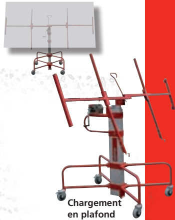
Chargement en plafond