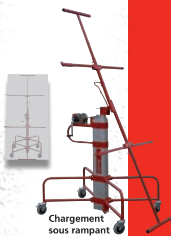
Chargement sous rampant